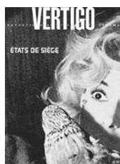
N°32 – novembre 2007 États de siège