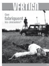
N°30 – avril 2007 Que fabriquent les cinéastes ?