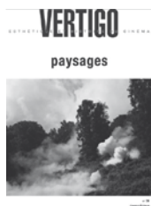
N°31 – juillet 2007 Paysages