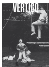
N°33 – juin 2008 Personnages contemporains Pierre Zucca