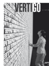
N°34 – octobre 2008 Japon