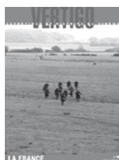
N°29 – décembre 2006 La France Territoires, paysages, décors